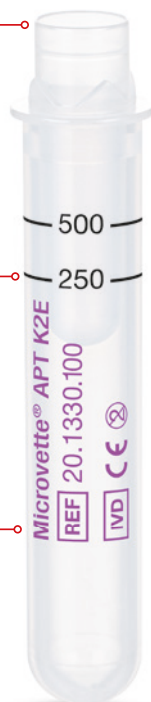
Microvette® APT 500

Zeitsparende Analytik – direkt und hygienisch aus dem Primärgefäß. Neu entwickelter Membranverschluss gewährleistet gleichzeitig sicheren Transport und Versand der Probe.