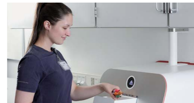
Las muestras se envían en Tempus600® Quantit.