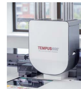
Las muestras se reciben en el Módulo de conexión Tempus600® o en la bandeja receptora en el laboratorio.