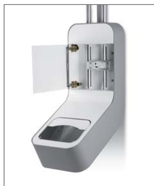
Prijímacia priehradka s brzdou