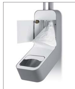
Filtračné vrecko na čistenie