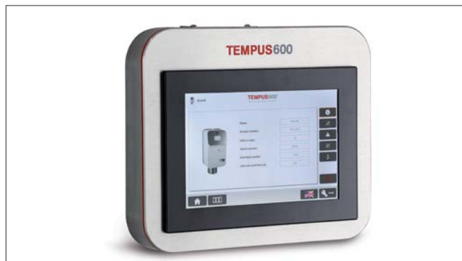
Intuitívne používateľské rozhranie