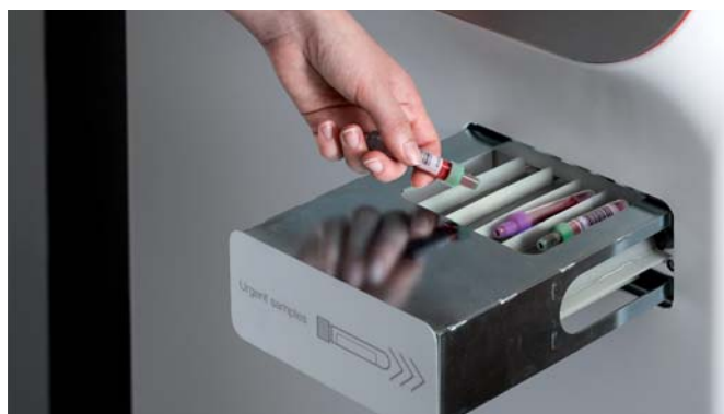
Modul pre urgentné vzorky