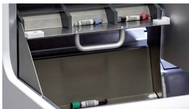
B: Modul pre urgentné vzorky