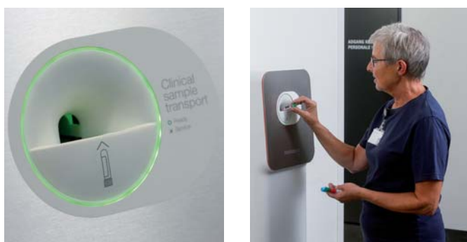
Skúmavky so vzorkami sa vložia do vstupného otvoru stanice Vita.

Vďaka štíhlemu a minimalistickému dizajnu sa odosielacia stanica zmestí na väčšinu miest a zaberie veľmi málo miesta.