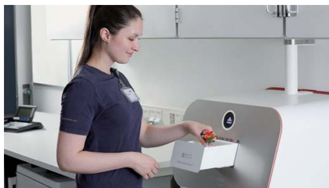
Viacnásobný vstup až pre 25 vzoriek naraz.