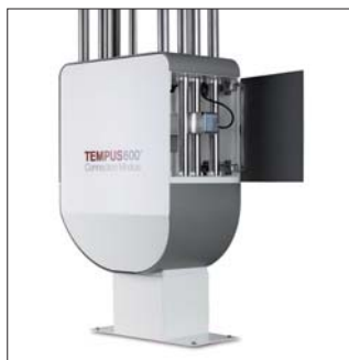
Pripojovací modul s brzdou