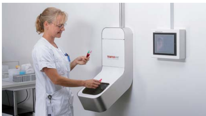
Vzorky dorazia do prijímacej priehradky, odkiaľ sa vyberú.