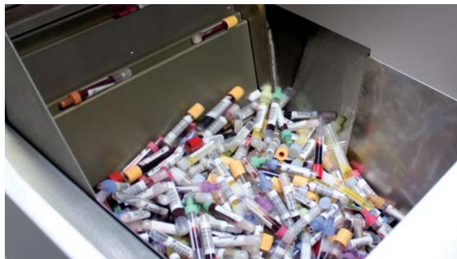
A: Triediaci modul

Tempus600® Necto sa štandardne dodáva s jedným odosielacím modulom. S riešením je možné objednať až tri ďalšie odosielacie moduly.