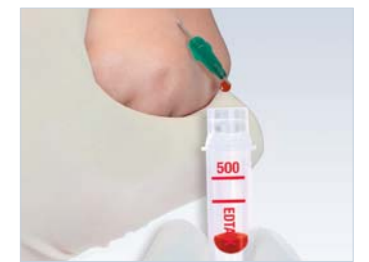
Microvette® jako nádobka na kapající krev