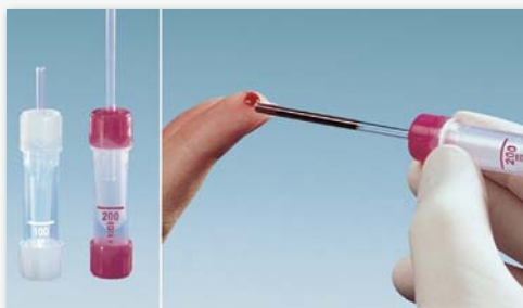
Microvette® 100/200 Prélèvement sanguin avec capillaire End-to-End