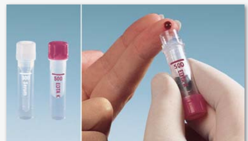
Microvette® 300/500 Prélèvement avec collecteur intégré

Informations complémentaires disponibles sur simple demande.